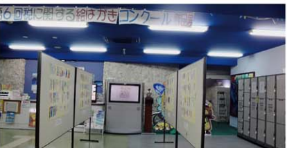
11/19~30 絵はがき作品展(ともーるネットセンター石垣)