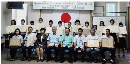
11/18 表彰式(大濱信泉記念館)