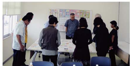
11/5 審査会(石垣港離島ターミナル第1会議室)