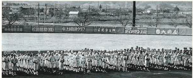
県内外の中学校14チームが集結