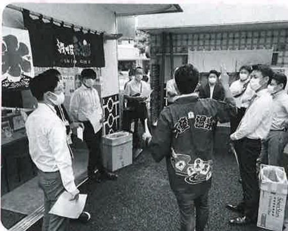
サポートする青年部会メンバー