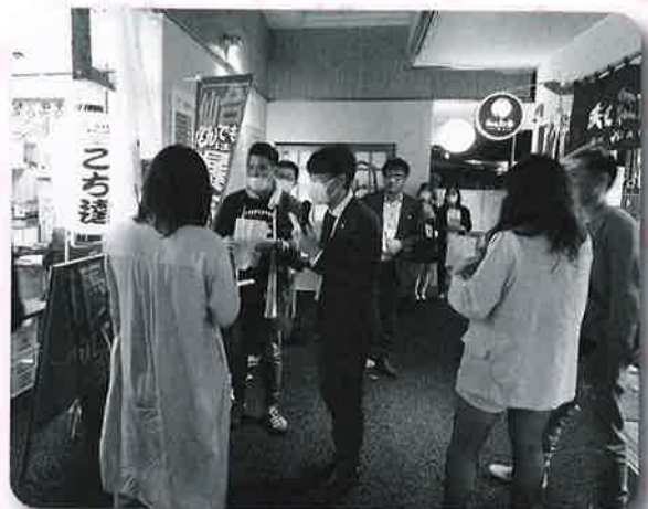
カップリング発表