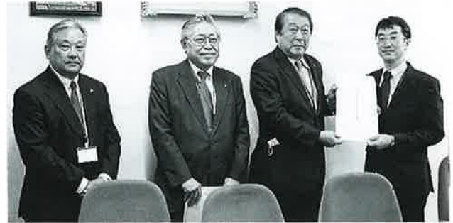
右から 飯田事業環境部長、飯野税制委員長、松崎専務理事、田中税制副委員長