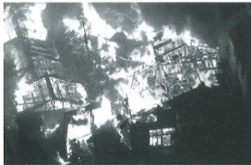
火災の被害を受けた「輪島朝市」(17日、石川県輪島市)