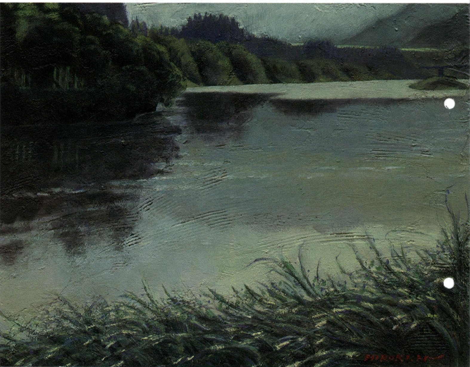
「雨あがり」 P10 油彩・キャンバス 作者 西塚 裕樹