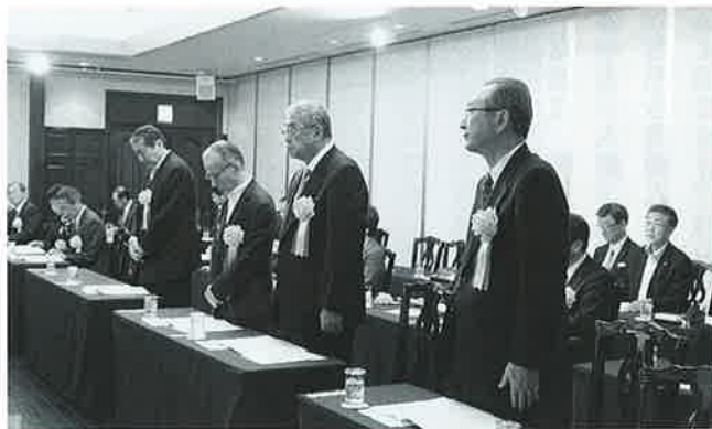
東北連表彰受賞者