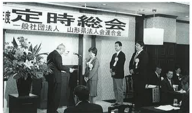
県連表彰 役員功労者表彰受賞者