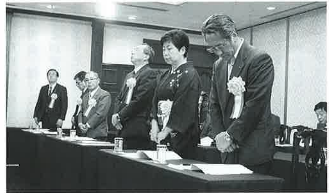
全法連表彰受賞者

法人会会員企業にお勤めの皆様は、お一人からでも集団取扱の割安な保険料でご加入いただけます。