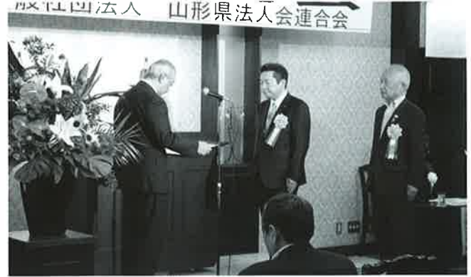
県連 会員増強優秀法人会表彰 (米沢法人会、新庄法人会)