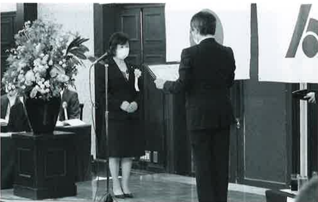
県連 職員功労者表彰受賞者