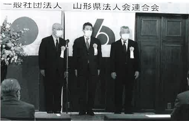
一般社団法人 山形県法人会連合会 全法連 単体会関係功労者表彰受賞者