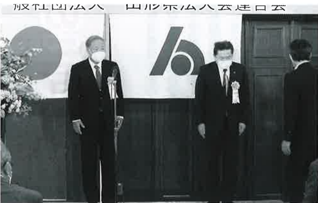
一般社団法人 山形県法人会連合会 県連 会員増強優秀法人会表彰 (酒田法人会、米沢法人会)