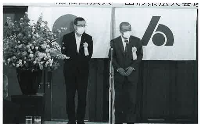
一般社団法人 山形県法人会連合会 県連表彰 役員功労者表彰受賞者