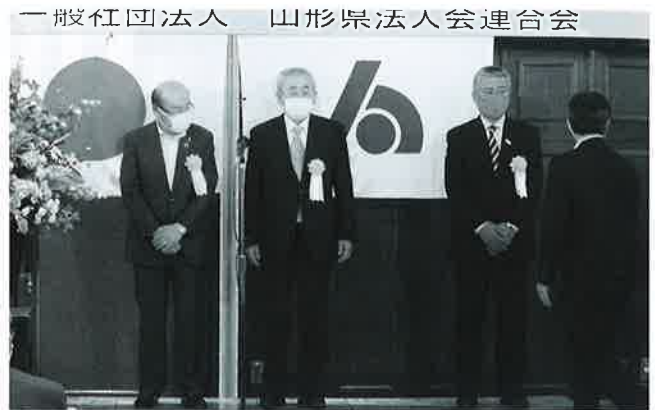
一般社団法人 山形県法人会連合会 東北連 優良役員表彰受賞者