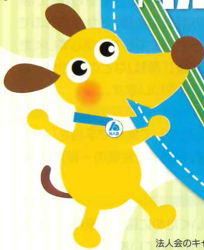
法人会のキャラクター 「Jenta」