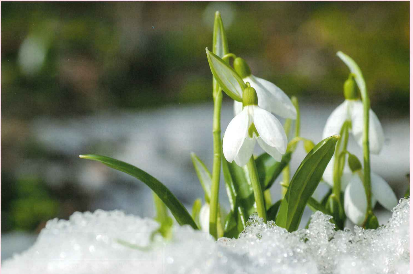
スノードロップ 花言葉「希望」