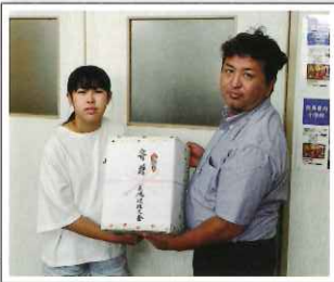
9/18 西馬音内小学校 (高嶋社会貢献委員長)