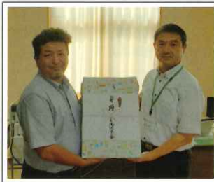
9/18 雄勝小学校 (高嶋社会貢献委員長)