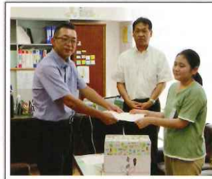
9/19 稲川小学校 (折原部会長)